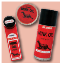
ミンクオイル 革に動物性ミンクオイルを与える