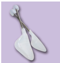
シューキーパー 靴の形を整えて型崩れ防止