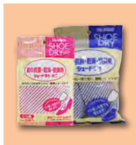
乾燥剤 濡れた靴の湿気を取る