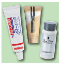
クリーナー 靴の汚れ落とし