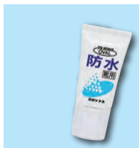
防水 雨や汚れから靴を守る