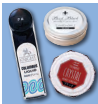
クリーム 革靴にツヤと栄養を与える